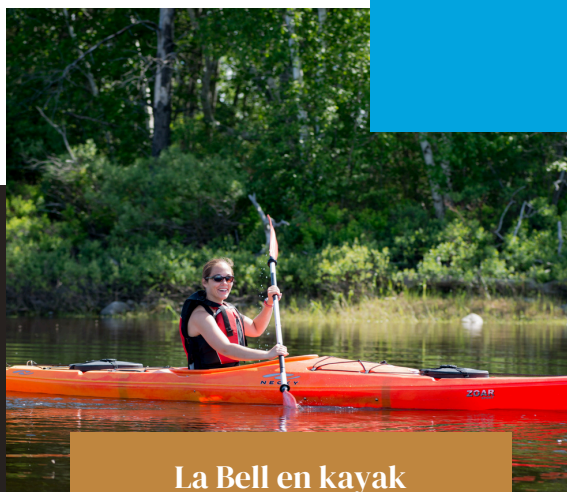
La Bell en kayak

Via le programme d'aide financière à la restauration visant à doter la communauté d'une offre de service adéquate, la CDE soutien une nouvelle entreprise dans l'ouverture de ses portes en 2025.