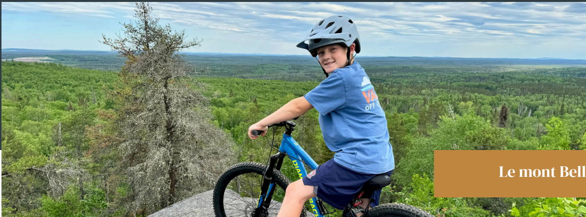
Le mont Bell

L'objectif est de bonifier l'offre touristique du mont Bell afin qu'il devienne une destination de choix en matière de tourisme de montagne en Abitibi-Témiscamingue. L'idée est de miser sur le développement d'activités écotouristiques quatre-saisons visant à accroître la clientèle.