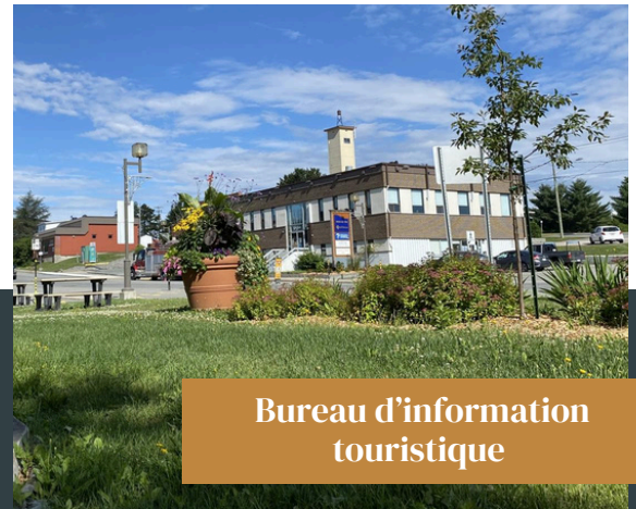
Bureau d'information touristique

Vigie des dossiers prioritaires en santé, foresterie, environnement et tourisme