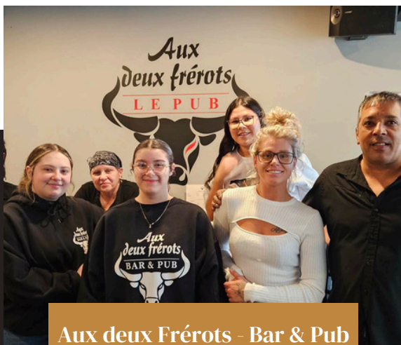
Aux deux Frérots - Bar & Pub